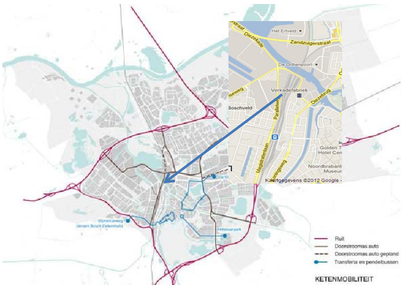
Koersnota Hoofdinfrastructuur: De ruit en doorstroommassen

In de Koersnota Hoofdinfrastructuur wordt het bundelen van verkeer op de ruit (A59, A2, westelijke Randweg –'s-Hertogenbosch ) en de doorstroommassen-auto bevorderd , teneinde te bereiken dat de verblijfsgebieden zoveel mogelijk verkeersluw blijven, het leefklimaat wordt bevorderd en het OV meer ruimte krijgt op de OV-doorstroommassen.. Hieronder is de ligging van de (toekomstige) parallelweg geprojecteerd in voornoemde ruit.