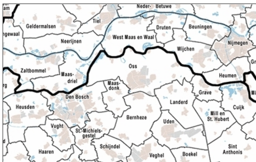
Figuur 1: Het herindelingsgebied met omliggende gemeenten

De regio Noordoost-Brabant is voor zowel Oss, Maasdonk als 's-Hertogenbosch een natuurlijke samenwerkingspartner. Samen met twintig gemeenten, bedrijfsleven en andere maatschappelijke partners wordt gewerkt aan een sterke regio en vormt het bijvoorbeeld ook de Veiligheidsregio. 's-Hertogenbosch neemt samen met Oss het voortouw binnen deze samenwerking. In het Meierijgebied werkt 's-Hertogenbosch samen met Heusden, Vught, Haaren, Boxtel, Schijndel, Sint Oedenrode en Sint Michiëlsgestel. Ook wordt binnen de B5 (de vijf grootste Brabantse gemeenten: Eindhoven, Tilburg, Breda, 's-Hertogenbosch, Helmond)) actief samengewerkt op een groot aantal thema's. De gemeente Oss werkt met Veghel, Uden en Bernheze samen in het zogenaamde As50 samenwerkingsverband. Over het algemeen zijn de drie gemeenten vertegenwoordigd in ieder meer dan 20, deels overlappende, samenwerkingsverbanden.