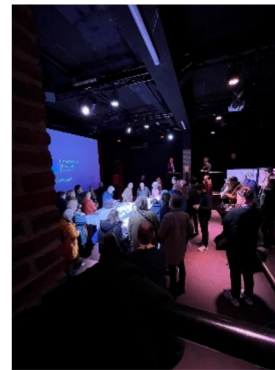
Impressies van de bijeenkomst