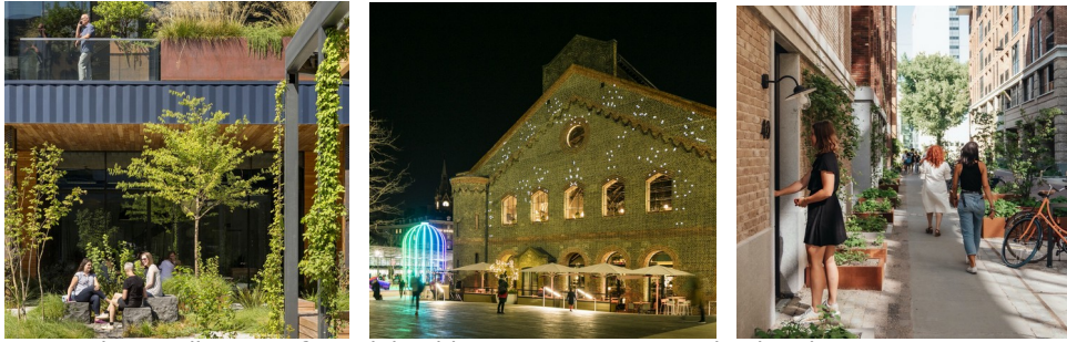
Impressie van diverse referentiebeelden waarop omwonenden konden reageren