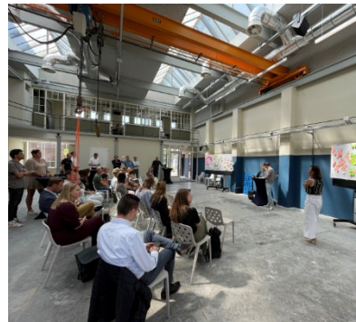
Impressie van de bijeenkomst