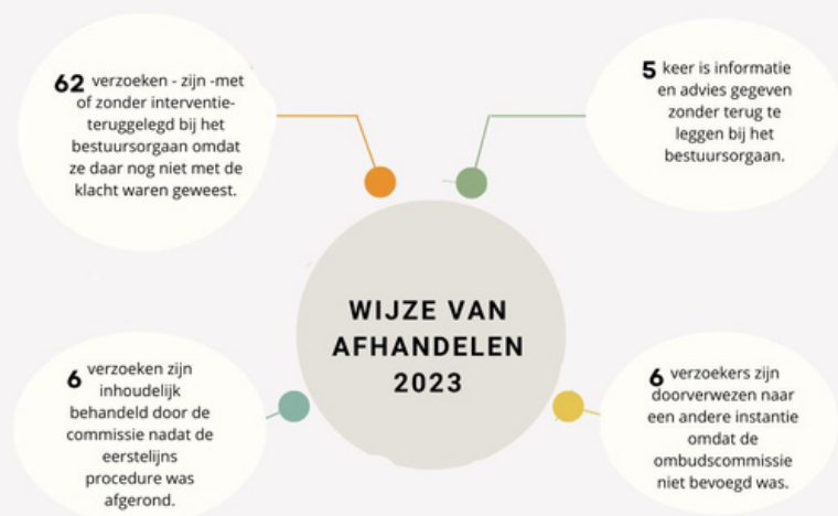
Figuur 2: wijze van afhandelen 2023

Het resultaat van de onderzoeken kan variëren. In 6 zaken heeft er een (inhoudelijk) onderzoek plaatsgevonden. In 1 verzoek heeft de ombudscommissie een rapport uitgebracht met een aanbeveling (zie casus 'Verwachting' op pg. 9). De aanbeveling ging erover dat bij de voorbereiding en uitvoering van besluiten de burgers die daar direct belang bij hebben rechtstreeks benaderd kunnen worden. Daarbij is het van belang om duidelijk te maken wat een verandering van beleid in een concrete situatie kan betekenen.